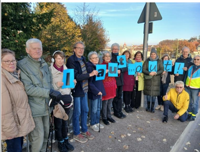
Aktion auf der Haller-Weg-Fußgängerbrücke über den OWD

Auf Bundesebene, im NRW-Verkehrssicherheitsprogramm und in der Bielefelder Mobilitätsstrategie wird die Vision Zero verfolgt – eine Mobilität ohne Getötete und schwer Verletzte. Der VCD stellt Daten zusammen und formuliert Schritte auf dem Weg zu dem anspruchsvollen Ziel.