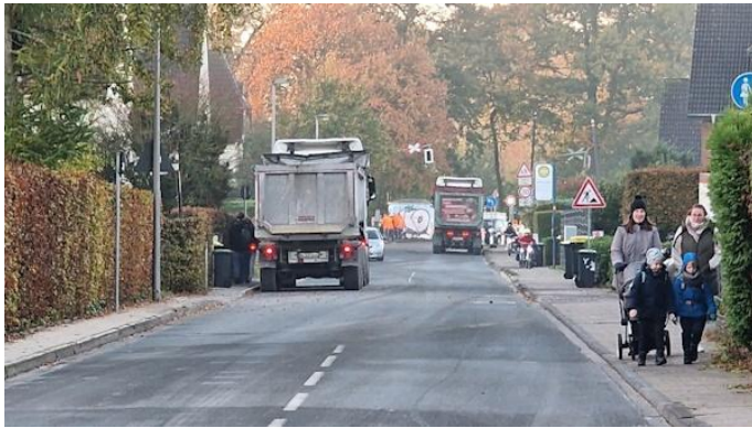
Riskanter Schulweg für die Queller Grundschul Kinder