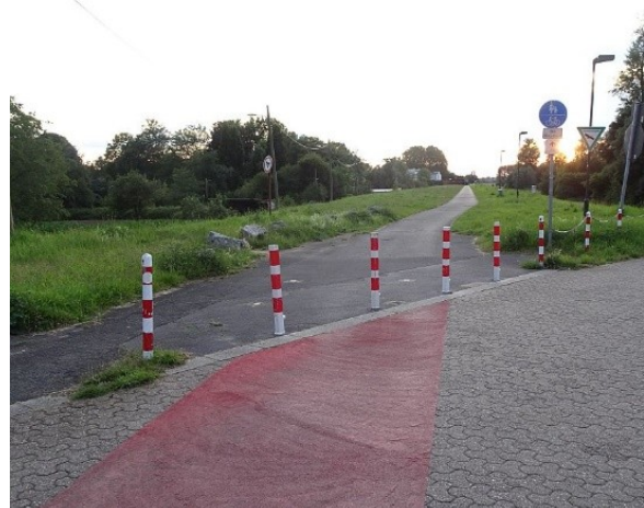
Fahrradfeindliche Poller auf dem Löricker Deich (sehr behindernd bis gefährlich z.B. für Kinderanhänger auf diesem touristischen Hauptradweg)

Anfrage der Partei KLIMA zu schmalen Fahrgassen: Die Zuständigkeit für das Freihalten der Fahrgassen und Kreuzungsbereiche für Rettungsdienste oder Müllwagen liegt bei der Verkehrsüberwachung, außerhalb deren Dienstzeiten beim OSD bzw. bei der Polizei. Die Stadt betonte in der Sitzung die „Verhältnismäßigkeit“ der Verkehrsüberwachung. Was soll das für die ungehinderte Zufahrt für Rettungsdienste bedeuten?