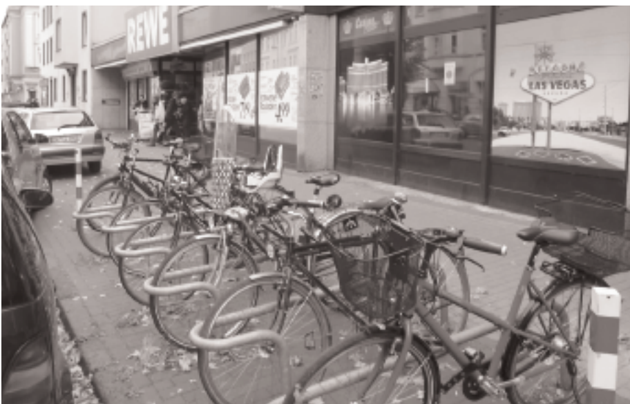
Vorbildlich: Fahrradständer vor dem Rewe an der Saarlandstraße. Für die hat aber nicht der Supermarkt, sondern die Bezirksvertretung Innenstadt-Ost gesorgt.

die öffentliche Hand - investiert hat. Die Handelsketten selbst, so scheint es, sind an Rad fahrenden Kunden nur mäßig interessiert, sonst würden sie vernünftige, im Vergleich zu Parkplätzen und Tiefgaragen dennoch preiswerte Fahrradbügel wie die Stadt Dortmund anbieten. MKS