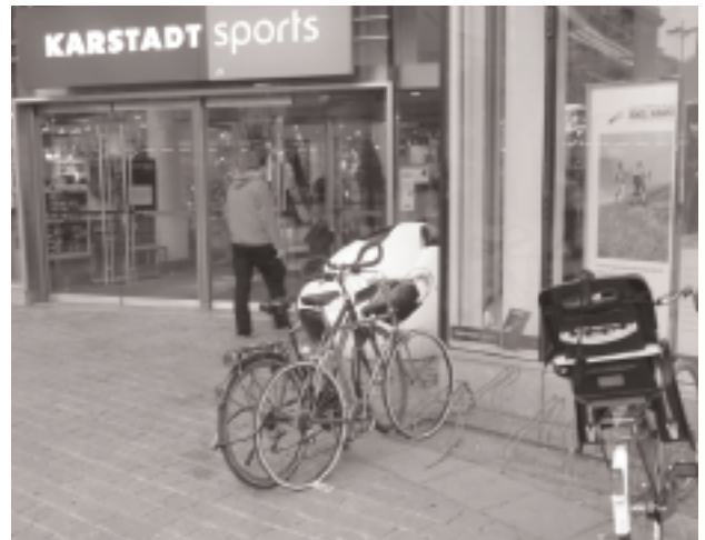
Billig-Stellplätze auch am größten City-Sportgeschäft

Wenn dann doch einmal brauchbare Fahrradständer vor einem Rewe stehen, dann nur, weil eine Bezirksvertretung - also