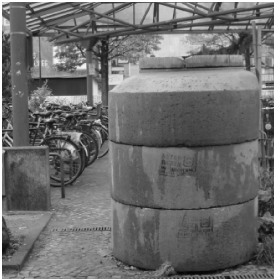
Die Tonne des Anstoßes.