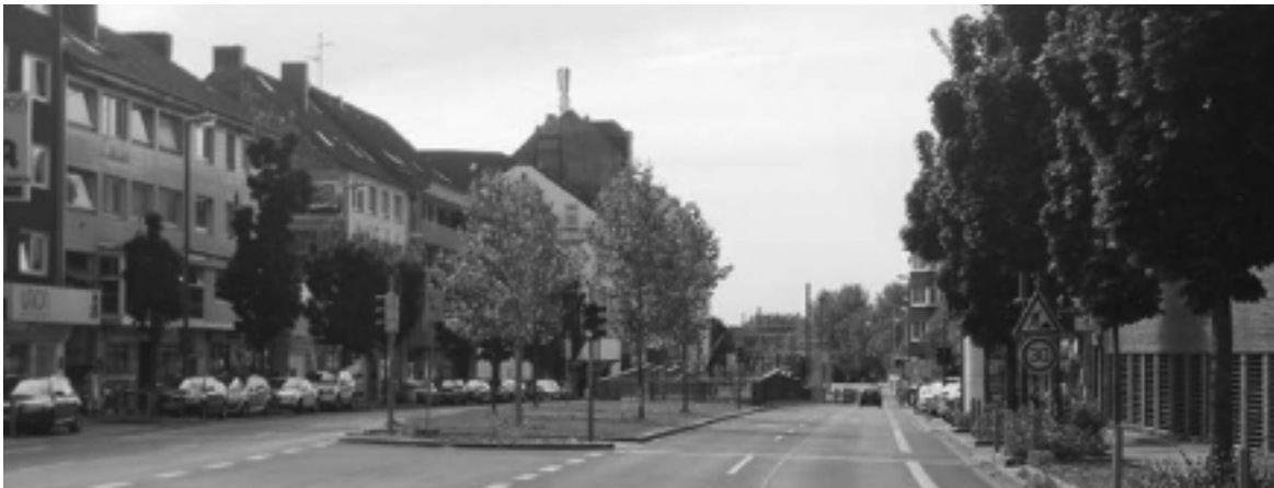
Wer (über)sieht die Ampeln? Rheinische Straße, Höhe Westfalenkolleg.