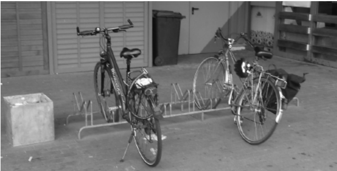
Nur ein Beispiel von vielen: Fahrradständer am Hornbach-Baumarkt an der Bornstraße. Für Autos gibt es großzügige Abstellflächen, für Radfahrer nur billige Felgenknacker.

Große Handelsketten wollen Zeichen der Zeit nicht erkennen